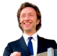
Stéphane Bern Journaliste / Écrivain