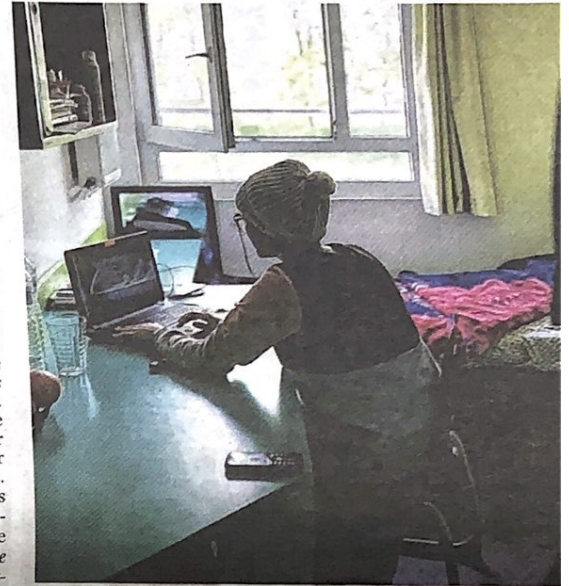
Toutes les démarches administratives de l'étudiant sont en attente. PHOTO D'ILLUSTRATION PIERRE ROUANET